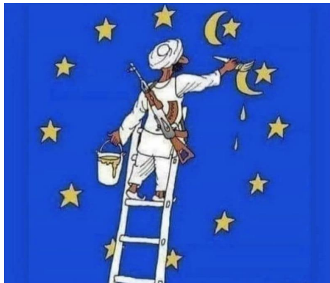
L'Europa è destinata a diventare un Califfato islamico