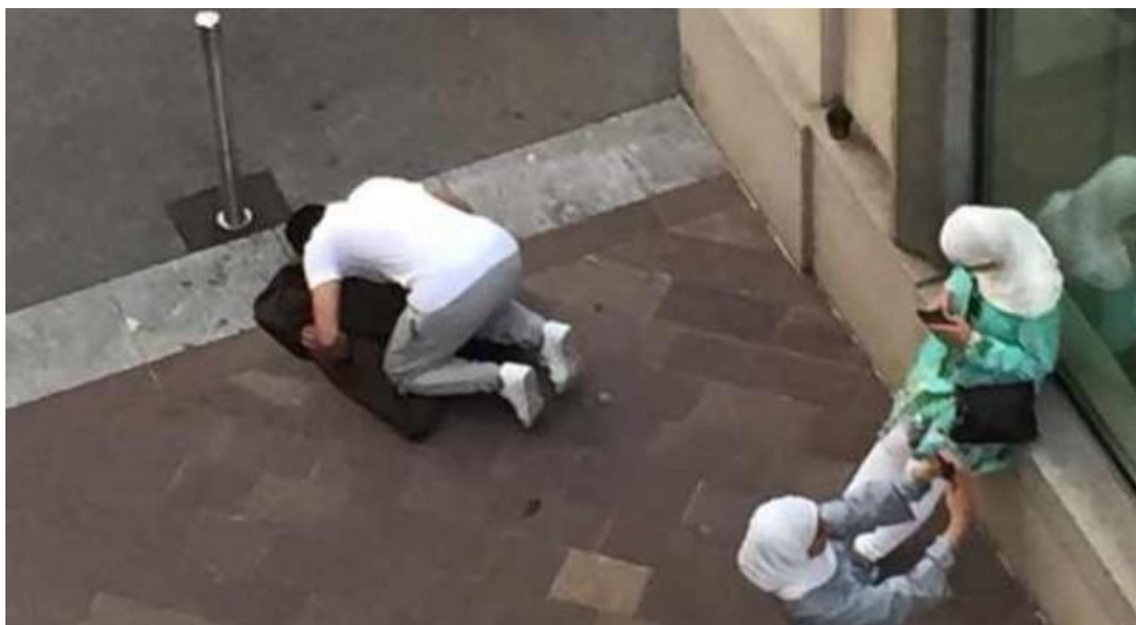
Foto scattata in pieno centro a Lugano il 28 agosto 2018 e pubblicata su Ticinonews il 29 agosto