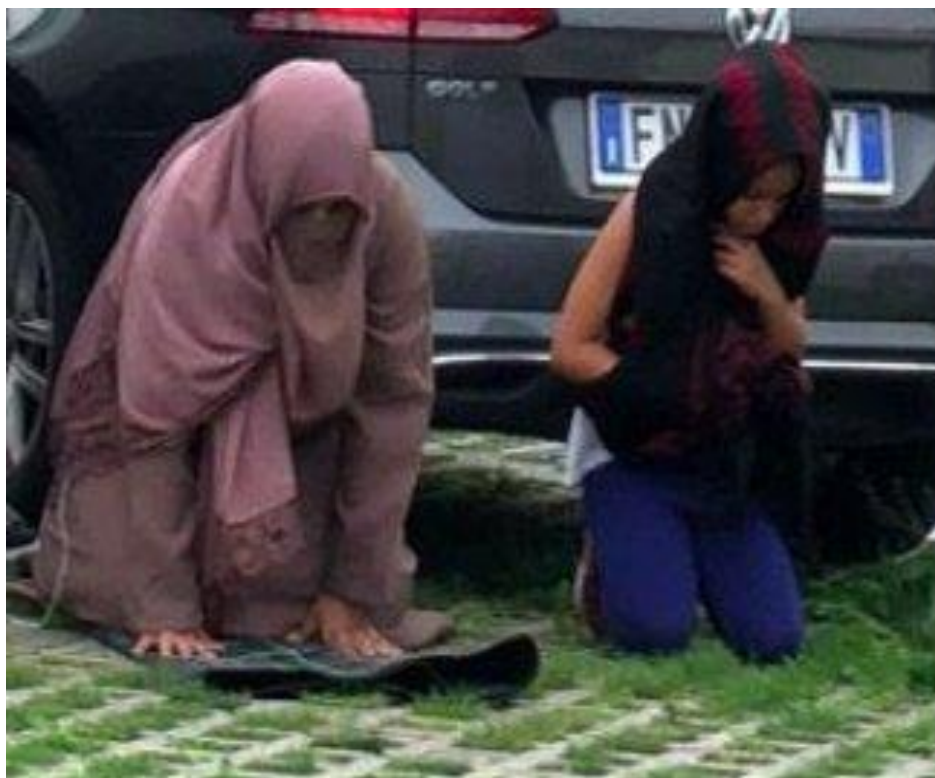
Questa foto è stata scattata nel giugno del 2018 nei posteggi del Foxtown